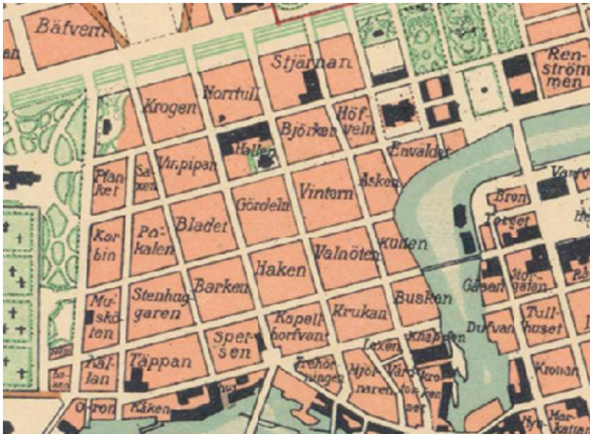
Norrköpingskarta ca 1908