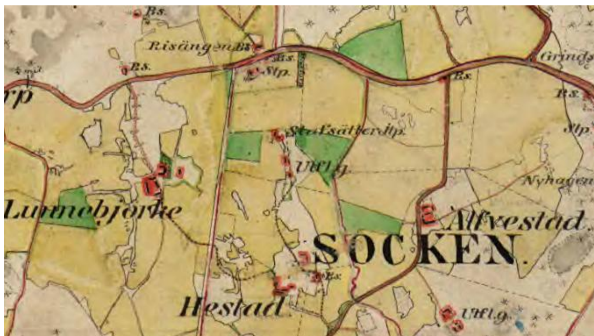
Vägen i övre elen av kartan är nuvarande väg 210