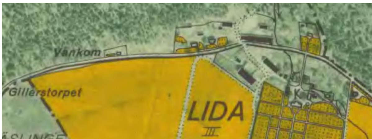
Ekonomiska kartan 1947