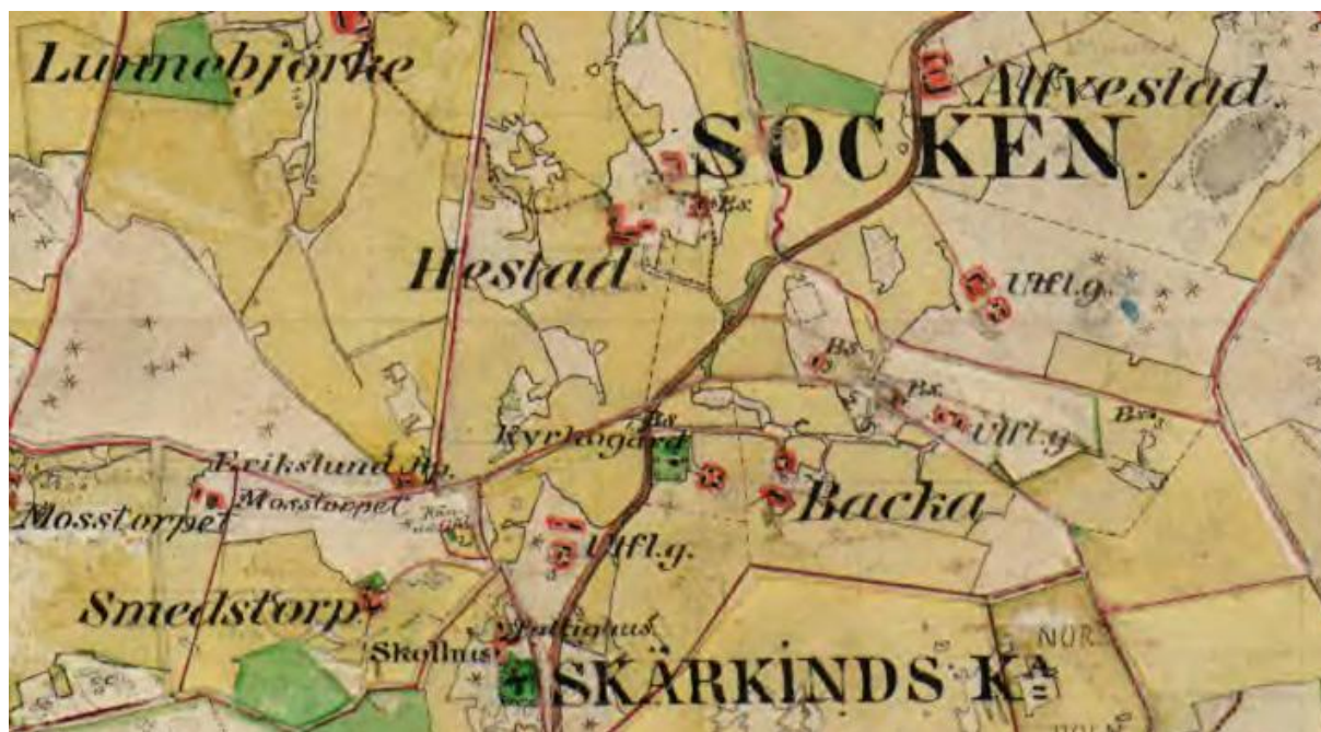
Häradsekonomska kartan ca 1865. Norr om kartbilden går nuvarande väg 210.