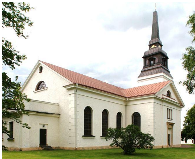
Skärkinds kyrka